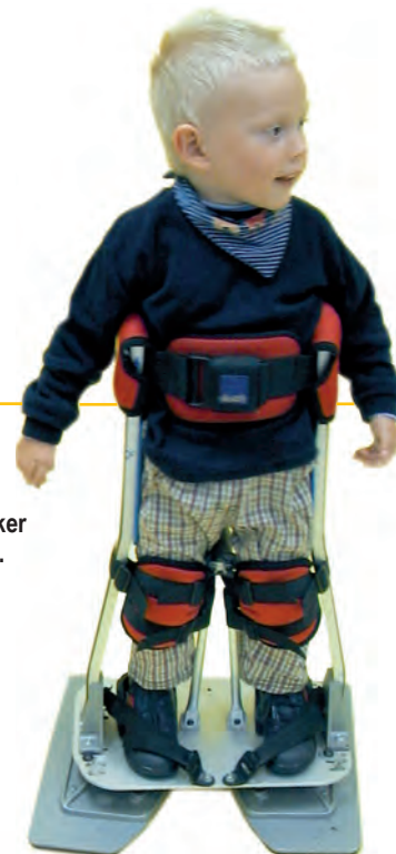
Swivel Walker Serie V.C.G.

Der Swivel Walker V.C.G. wird von Pro Walk für Kinder mit einer Achselhöhe von 550 mm bis zu 900 mm, für Jugendliche mit einer Achselhöhe von 900 mm bis 1400 mm nach Maßblatt in Sonderanfertigung geliefert.