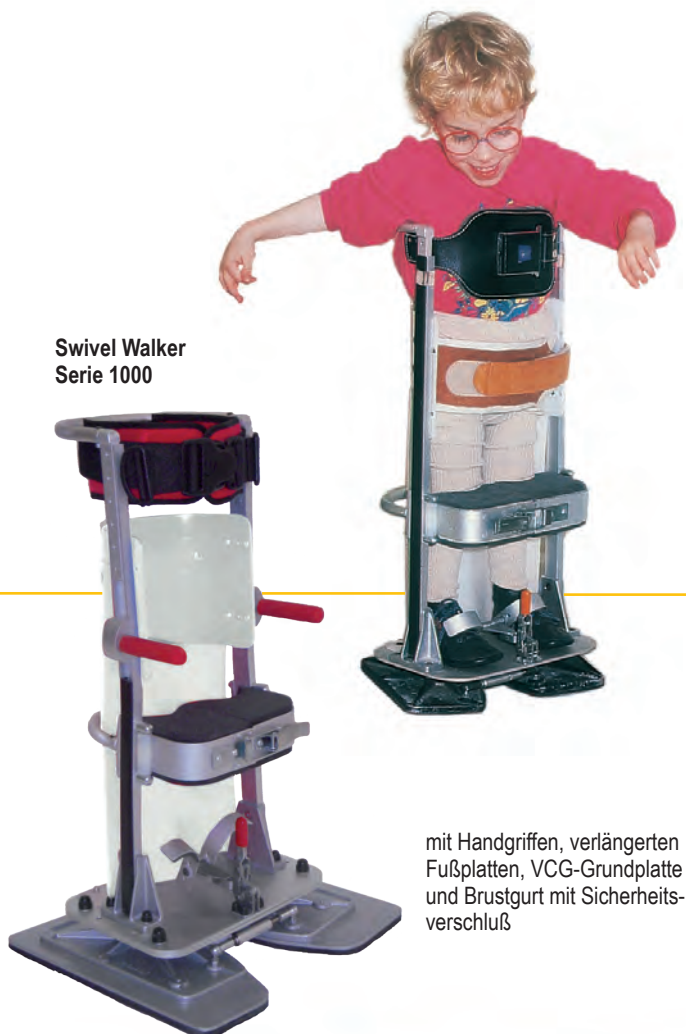
Swivel Walker Serie 1000

Bei Kindern mit einer Achselhöhe ab 900 mm ist aus Stabilitätsgründen und zur Ausnutzung des Wachstumspotentials die Sonderanfertigung des Swivel Walker Serie 1500 für Jugendliche zu empfehlen, eine solide und robuste Konstruktion für Patienten mit einer Achselhöhe bis 1400 mm.