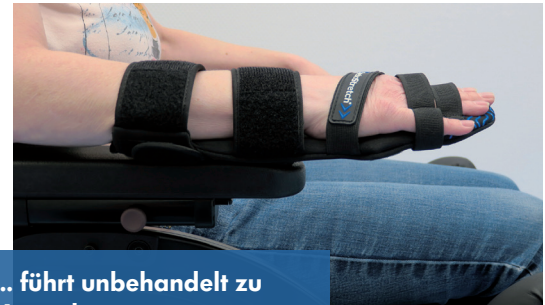
... führt unbehandelt zu Kontrakturen

Liegen Kontrakturen vor, behindern aufwändiges Zurückdrängen und die damit verbundene Funktions- und Bewegungseinschränkung die funktionelle Rehabilitation der Hand.