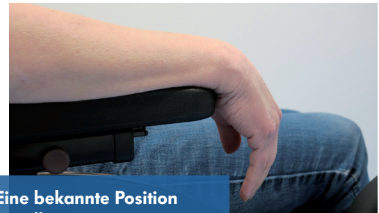
Eine bekannte Position im Alltag...

Auf den ersten Blick sieht die SaeboStretch® aus wie ein Unterarm-Gelenksschutz für Inlineskater. Sie besteht dabei aus drei Grundkomponenten, die unter der Hand, am Handgelenk und am Unterarm durch Manschetten fixiert werden. Diese Komponenten sind durch ein Federstahlsystem miteinander verbunden. Die Positionen von Daumen und Hand lassen sich jeweils individuell einstellen, ebenso die Federstärke der Orthese. Die Patienten können die Orthese in der Nacht tragen, aber ebenso tagsüber.