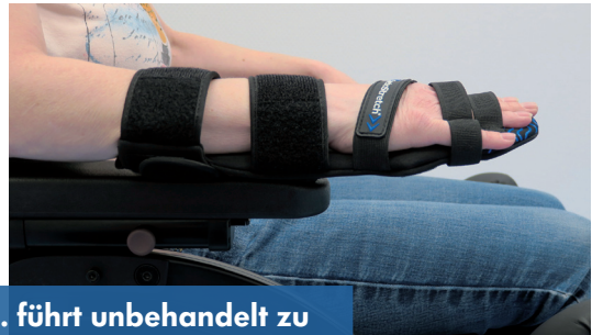
... führt unbehandelt zu Kontrakturen

Liegen Kontrakturen vor, behindern aufwändiges Zurückdrängen und die damit verbundene Funktions- und Bewegungseinschränkung die funktionelle Rehabilitation der Hand.