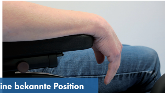
Eine bekannte Position im Alltag...

Auf den ersten Blick sieht die SaeboStretch® aus wie ein Unterarm-Gelenksschutz für Inlineskater. Sie besteht dabei aus drei Grundkomponenten, die unter der Hand, am Handgelenk und am Unterarm durch Manschetten fixiert werden. Diese Komponenten sind durch ein Federstahlsystem miteinander verbunden. Die Positionen von Daumen und Hand lassen sich jeweils individuell einstellen, ebenso die Federstärke der Orthese. Die Patienten können die Orthese in der Nacht tragen, aber ebenso tagsüber.